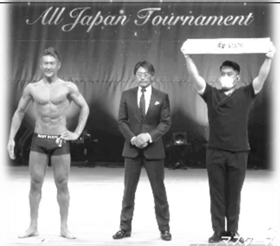
千葉で行われたポティーメイクの コンテストでケンゾーが優勝しました！