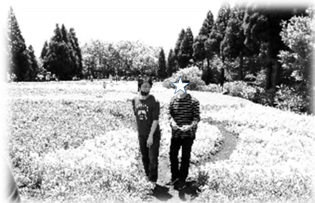
お花畑で思い出のシャッターチャンス♡♡