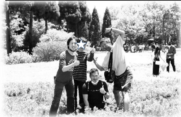
九重の花公園は、まるで天国に行っちゃったかのようなお花畑でした！