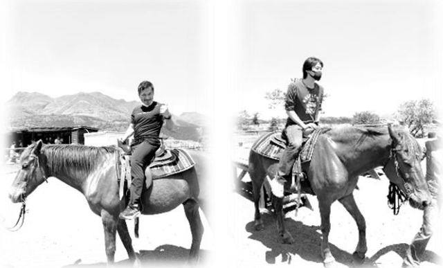
九重高原で馬に乗っちゃいましたー(〇〇)/