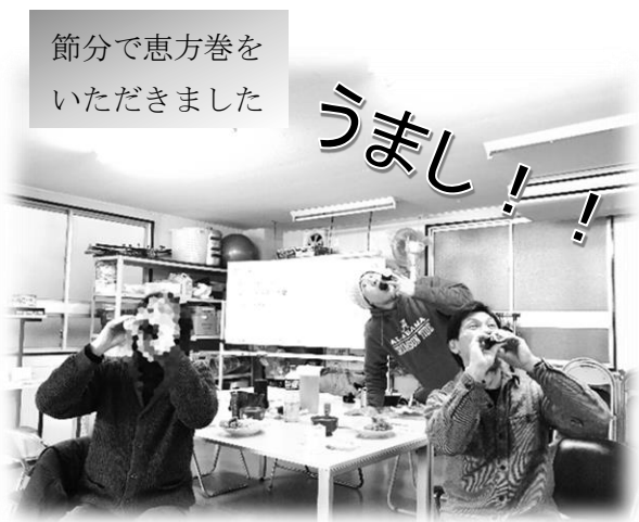
節分で恵方巻をいただきました