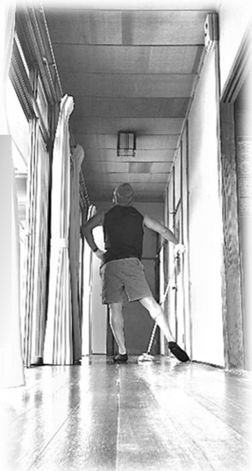
年末恒例の寮の大掃除